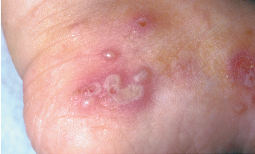
Typisches Krankheitsbild bei Scabies