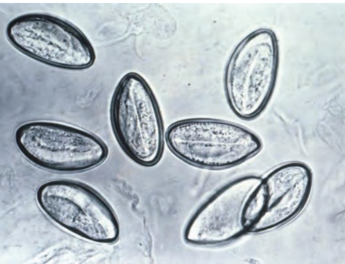
تخم کرم‌ها اندازه طبیعی: 20 \times 60 میکرومتر

در صورت تشخیص آلودگی و عفونت انگلی از سوی پزشک، باید مداوا حتماً با استفاده از یک داروی ضد انگل (به اصطلاح داروهای انتهلیمینتیک) صورت بگیرد. ترکیبات فعال در داروهای انتهلیمینتیک طی سال‌های متمادی تأثیر مفید خود را به اثبات رسانده‌اند و ارگانسیم بدن آنها را به خوبی تحمل می‌کند. این داروها در بدن جذب نمی‌شوند و تنها کرم‌های انگلی در دستگاه گوارشی را مورد حمله قرار می‌دهند. بی‌عارضگی این داروها یکی از صفات متمایز کننده آنها نسبت به سایر ترکیبات فعال در داروهای دیگر است. برای اطلاعات بیشتر به پزشک خود مراجعه کنید.